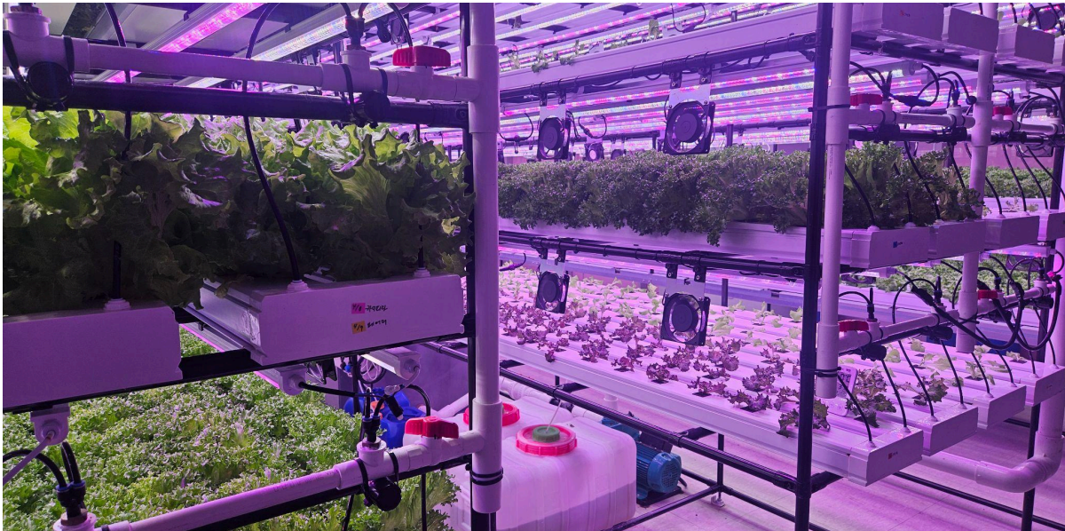
사진 | 유럽형 상추(프릴아이스, 미니로메인, 버터헤드, 카이피라 등) 재배 중인 식물공장

식물공장 조건에서 주로 기르는 유럽형 상추류는 육묘 20일 안팎으로 정식한뒤 재배 베드에서 약 30일을 재배하는 경우가 대부분입니다. 연중 재배를 하는 식물공장의 경우 재배일수가 짧을수록 연간 수확횟수가 늘어나기 때문에 수익성과 직결되게 됩니다. 때문에 재배일수가 길지 않으면서 kg당 단가가 적절한 금액인 작물을 선택하는 것이 중요합니다.