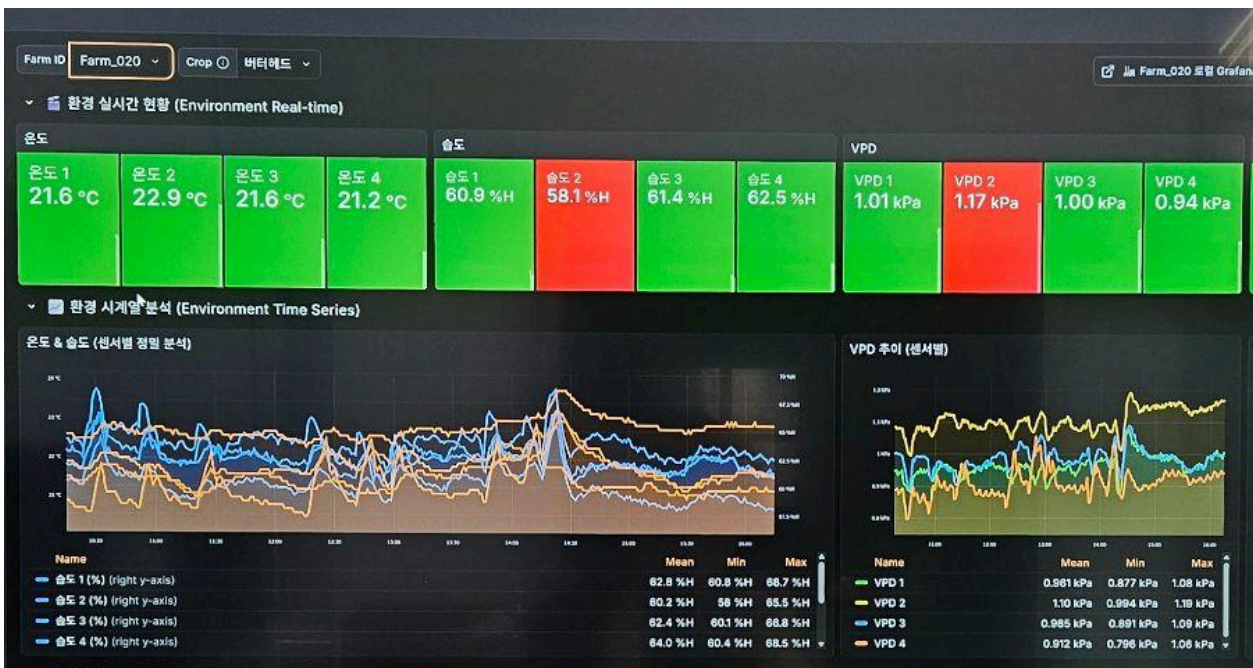
사진 | 식물공장의 온습도 및 VPD 모니터링 화면

식물공장의 경우 한정된 공간에서 다량의 식물을 재배하기 때문에 온도를 동일하게 유지하는 경우, 식물이 내뿜는 수증기로 인해 습도가 높아지며 VPD가 낮아지기 쉽습니다. 특히 과습으로 인해 병해가 오는 경우 밀집된 작물로 인한 피해가 크기 때문에 주의가 필요합니다. 시설을 설치할 때 제습기를 용량을 충분히 확보하고 수시로 VPD를 확인하여 식물공장 내부가 과습한 상태가 되지 않도록 조절하는 게 중요합니다.