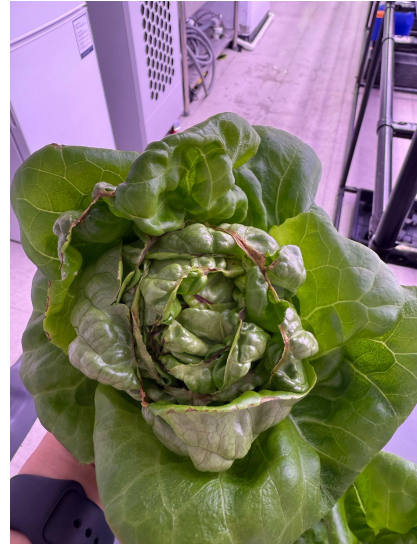
속이 탄 경우