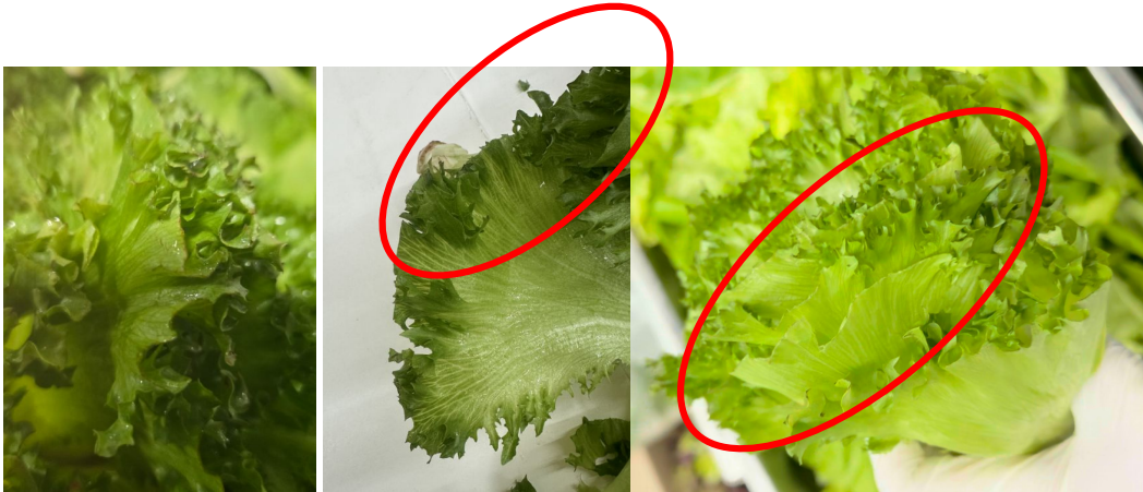
외관 품질 저하